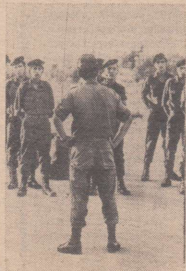
АРМИЮ ПОПОЛНЯЮТ УГОЛОВНИКИ

не отбыв положенного срока. «Великодушные» тюремной администрации, досрочно выпустившей на свободу этих лиц, осужденных за тяжкие преступления, объясняется просто: Тель-Авив, проводящий агрессивный курс, отбросил всякую щепетильность и вербует «пушечное мясо» даже среди уголовных элементов.